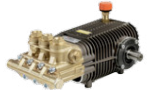
TW 500 Premium