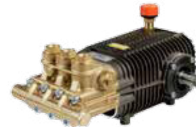
TW 500 Premium